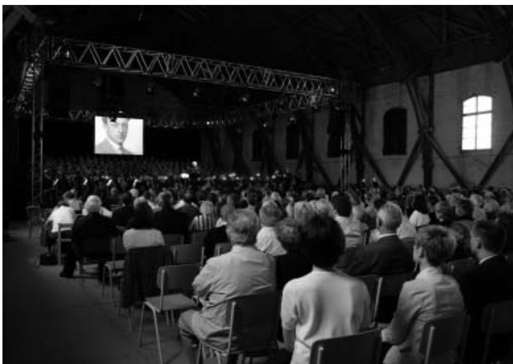
Z koncertu „Defiant requiem“ v Terezíně

V tomto roce nás čeká opět mnoho práce - vedle zajištění řady vzpomínkových akcí to bude plnění úkolů vyplývajících z dlouhodobé koncepce naší činnosti, uspořádání odborného semináře k 70. výročí vzniku policejní věznice gestapa v Malé pevnosti, uspořádání celkem deseti výstav (z nich bych chtěl připomenout alespoň výstavu k 65. výročí osvobození a výstavu z přírůstků našich sbírek), provedení Beethovenovy 9. symfonie ve IV. dvoře Malé pevnosti a řada dalších úkolů.