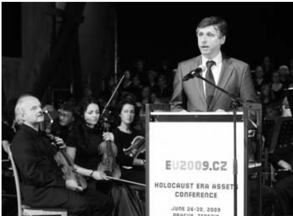
Jan Fischer, předseda vlády ČR, na mezinárodní konferenci „Holocaust era assets“